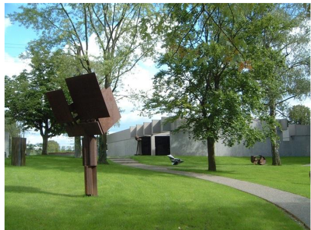
Skulpturenpark Sammlung Domnick, Werner Esser