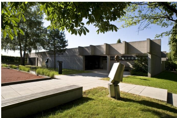
Außenansicht Sammlung Domnick, Rose Hajdu