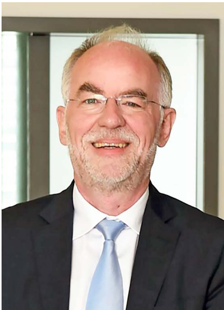
Dezernent Norbert Brugger vom Städtetag Baden-Württemberg.

Ausbau der Ganztagschulen, Sozialraumorientierung und Impulse zur Lebensgestaltung – die Schulsozialarbeit ist für die Städte unverzichtbar. Ein Gespräch mit Norbert Brugger, Dezernent des Städtetags Baden-Württemberg.