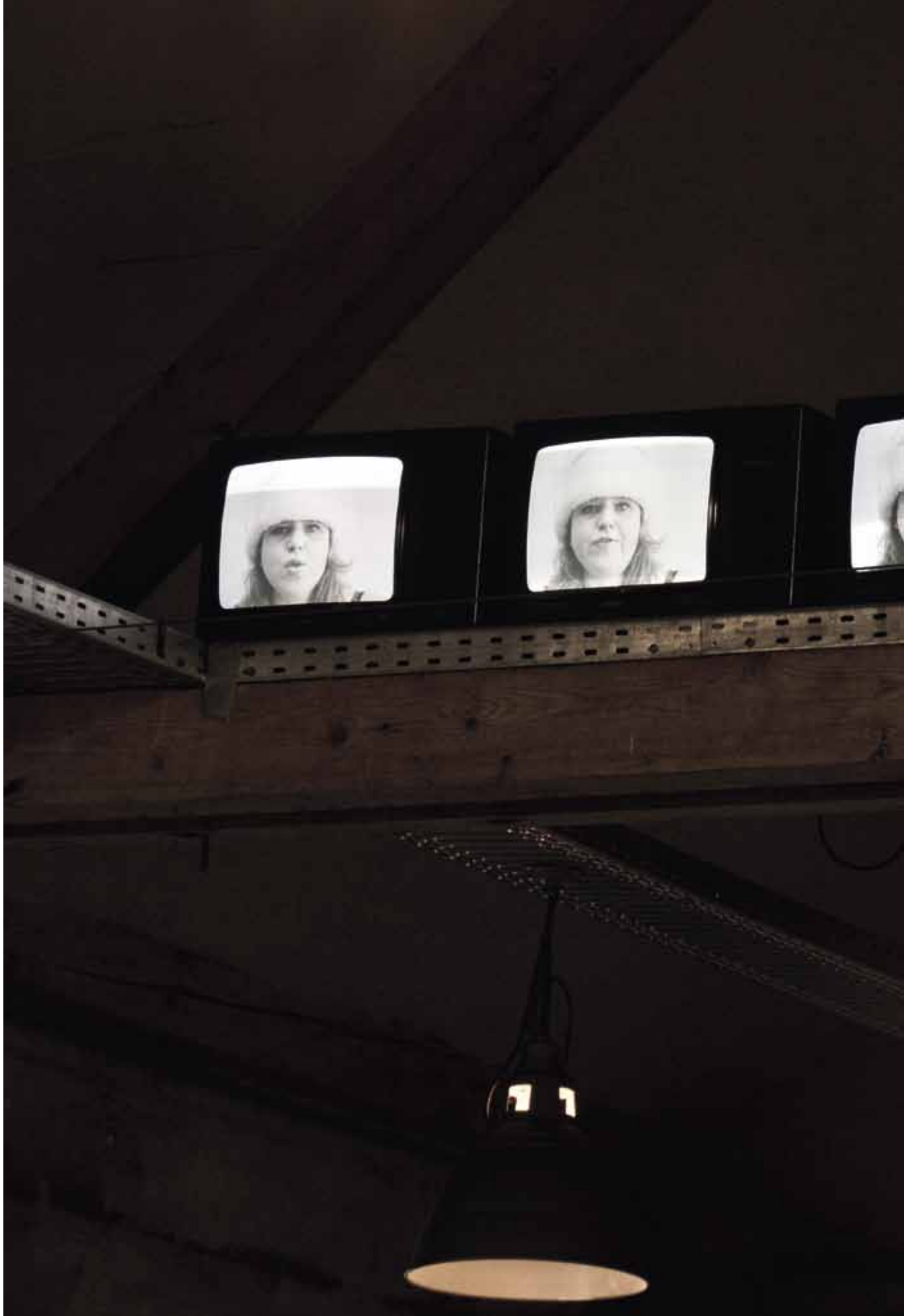
Der Tod geht um 2011 Videoinstallation