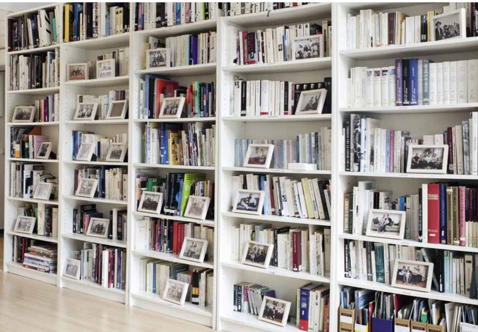
Rauminstallation la famille sur le sofa 2010 Wohnzimmereinrichtung Ligne Roset, Bücherregal 28 Fotografien 13 x 18 cm Objektrahmen