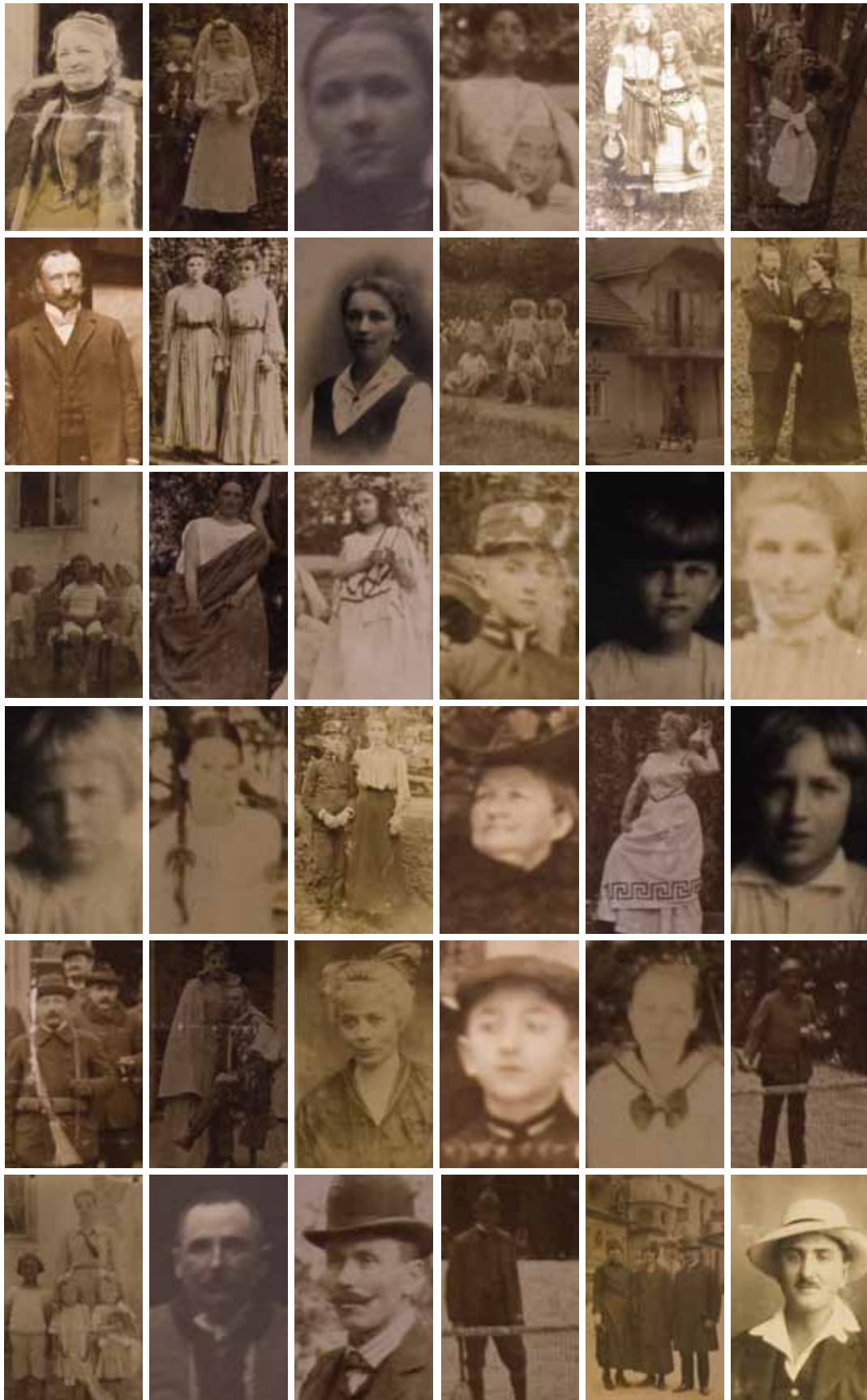
Ahnengalerie 2010 Fotografien 10 x 15 cm