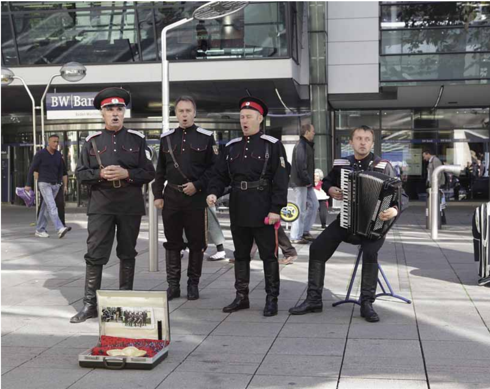
Die Russen kommen 2012 C-Print 60 x 80 cm gerahmt