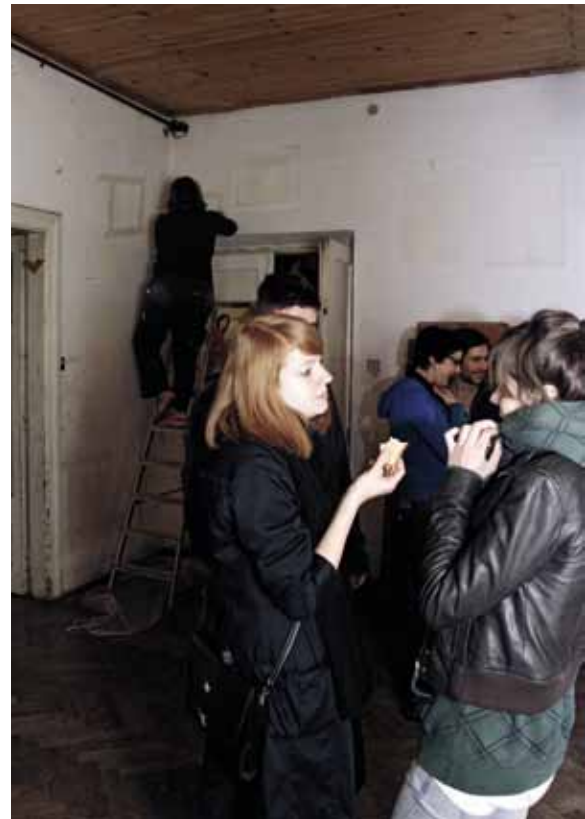
Superfinish 2010 Dauerperformance Referenzflächen anputzen (Immobilienaufwertung)