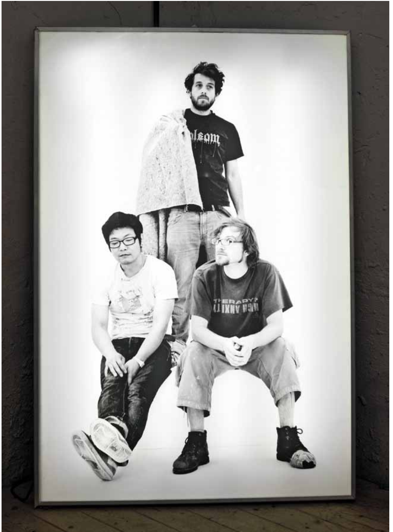
Vintage I (Arbeiterdenkmal) 2013 Farbstrahlintendruck auf UV-Backlithfolie Leuchtkasten 173 × 116 × 25 cm