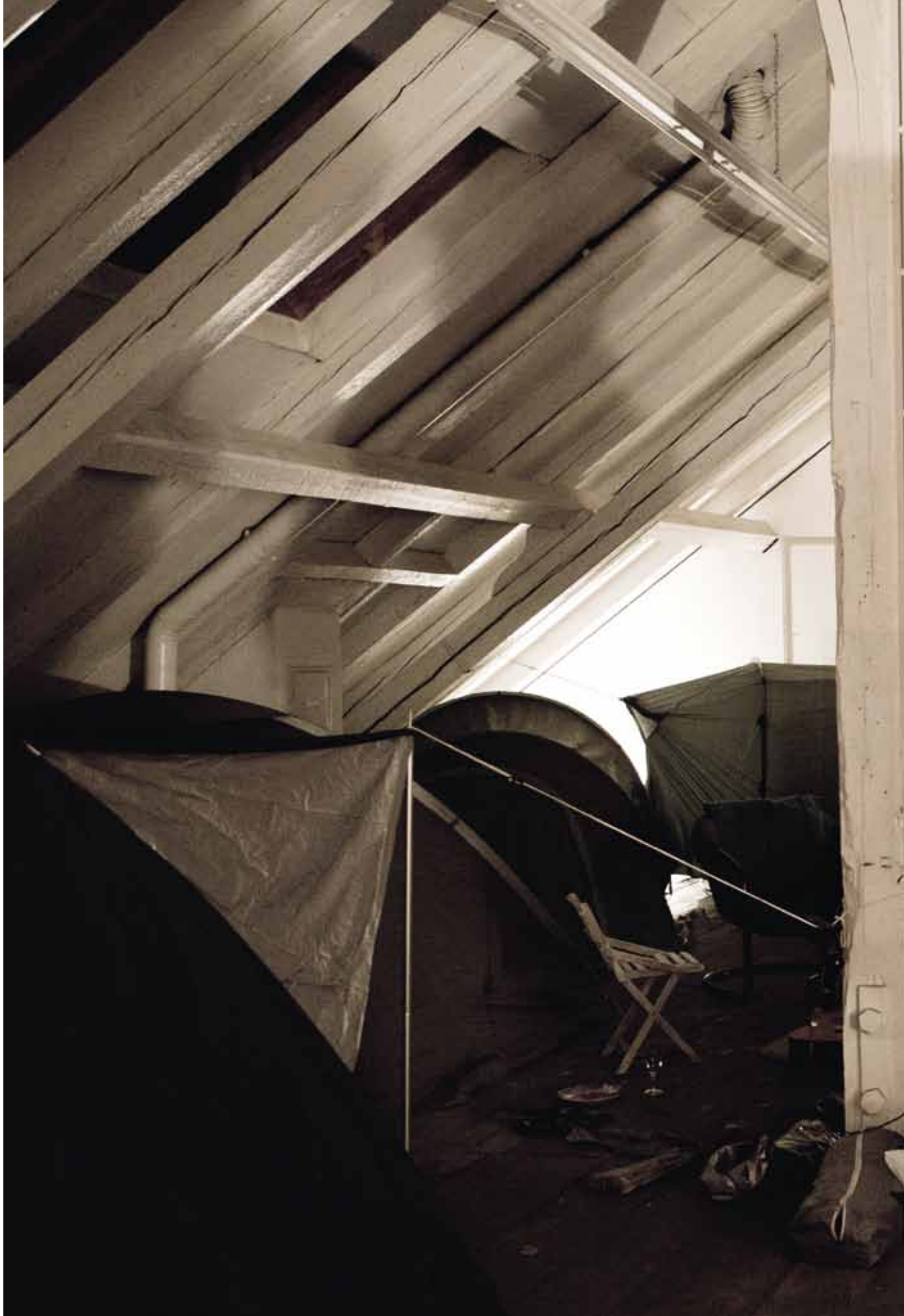
Zelten im Atelier (mit Liedgut aus der Jugend) 2010 C-Print 50 x 70 cm Objektrahmen