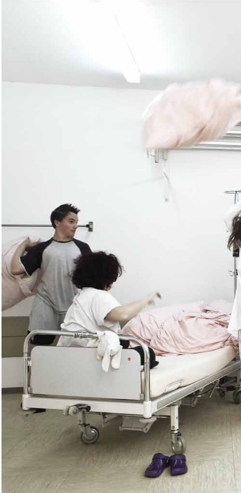
Battle Schloss Winnenden 2011 C-Print 60 x 80 cm gerahmt