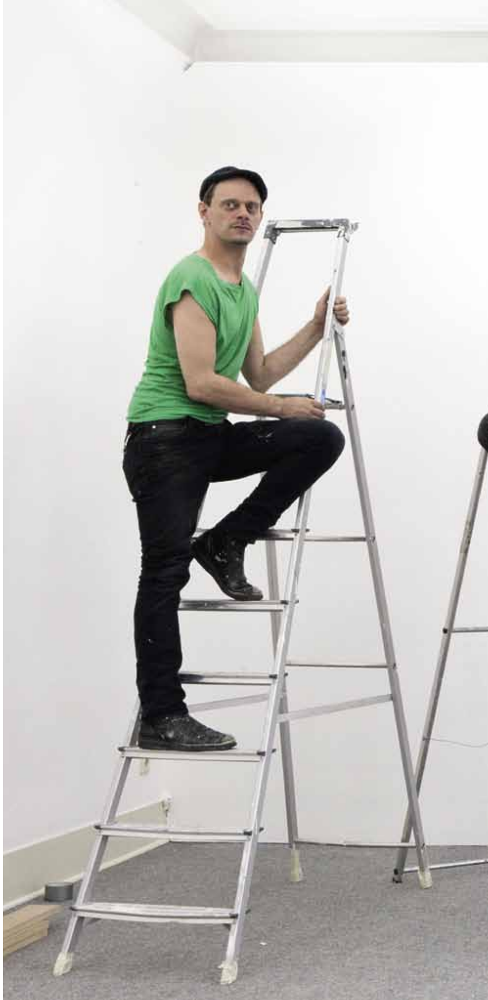
Menschen auf Leitern 2012/2013 C-Print 60 x 80 cm gerahmt