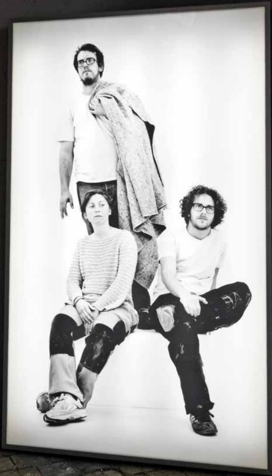
Vintage II (Arbeiterdenkmal) 2013 Farbstrahlintendruck auf UV- Backlithfolie Leuchtkasten 165 × 100 × 25 cm