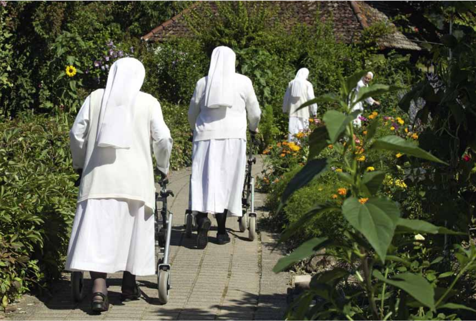
Paradies II 2013 C-Print 40 x 60 cm gerahmt