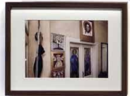
Ausstellungsansicht Geschichte einer Wohnung in Krakau 2010/2013 C-Prints 20 × 30 cm gerahmt mit Passepartout