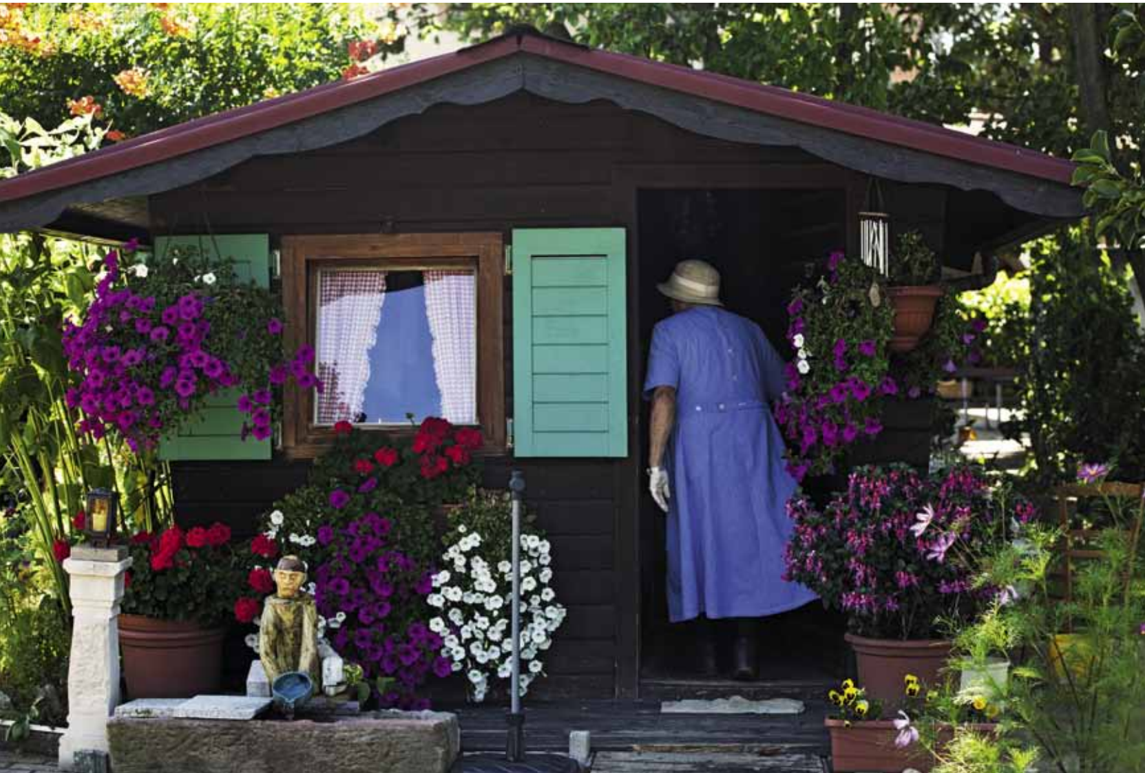
Paradies I 2013 C-Print 40 x 60 cm gerahmt