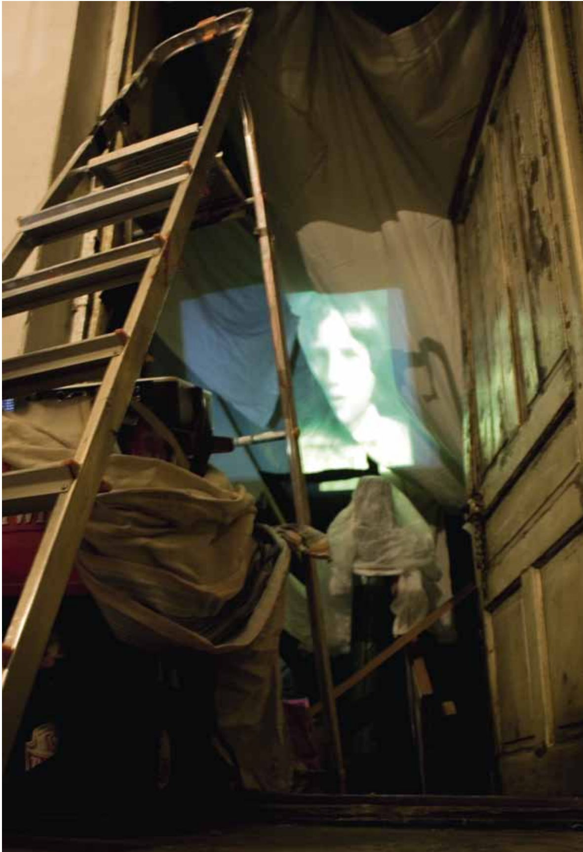
Ahnengalerie (spooky Videoinstallation) 2010 Leitern, Leinentücher, Wäsche, Möbel und Einrichtungsgegenstände im Treppenhaus